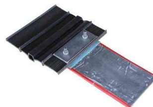
Anslutningsklämma Contaflex För anslutning till fogband