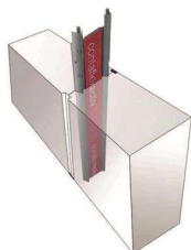
Sprickanvisare MSA (1,5 m/st) Anvisar sprickor för att möjliggöra gjutning av längre etapper