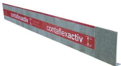
Fogbleck ACF (med fot, 2,25 m/st) Monteras med hjälp av bleck i foten