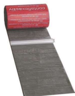
Svällande tejp ACS (på rulle, 9 m/st) För reparation eller komplettering av svällande beläggning