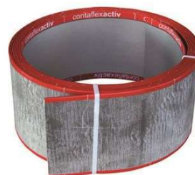
Fogbleck ACR (på rulle, 9 m/st) Monteras med byglar eller genom att sänkas ner direkt i den färska betongen